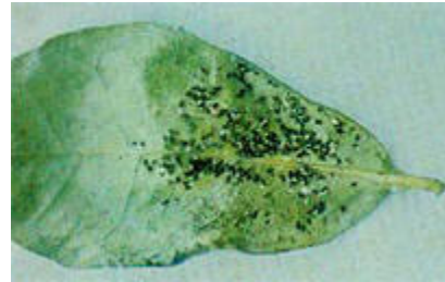
Hoja atacada por la Mosca prieta ( Aleurocanthus woglumi )