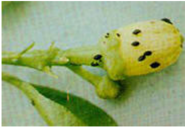
Flores atacadas por el Pulgón pardo ( Toxoptera aurantii )