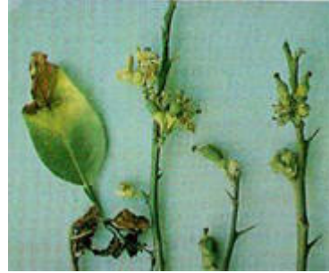
Antracnosis ( Colletotrichum gloeosporioides ) en rama y hojas del limonero.