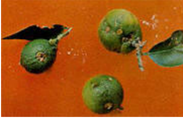
Antracnosis ( Colletotrichum gloeosporioides ) en hoja de cítrico