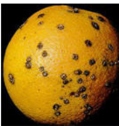
Bacterial Canker ( Xanthomonas campestris pv. citri )

La Fumagina surge secundariamente como resultado del ataque de ciertos insectos como pulgones, mosca blanca, etc. que se pueden controlar con depredadores naturales y controles fitosanitarios.