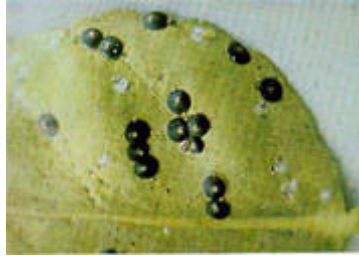
Hoja atacada por la Guagua roja de la Florida ( Chromaphysalis aonidium )