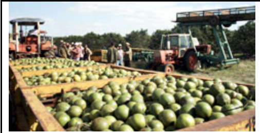
Cítricos: JAGÜEY GRANDE