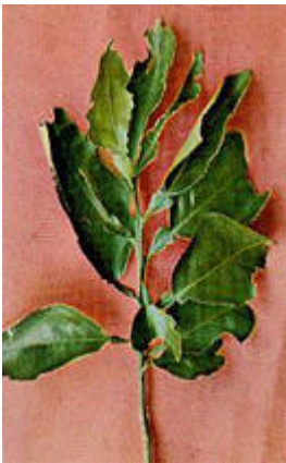
Una rama de naranjo dañada por la bibijagua ( Atta insularis )