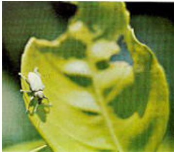
Picudo verde azul en hoja de cítrico ( Pachnacus litus Germar)