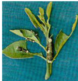
Larvas del perro del naranjo ( Papilio andraemon ) atacando una rama de cítrico