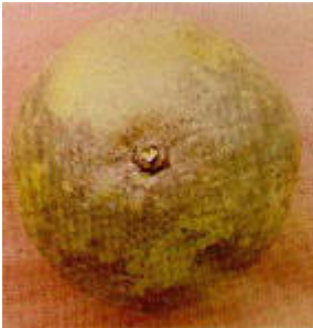
Fruto de toronja con Fumagina ( Capnodium citri )

La Melanosis es causada por el agente Diaporthe citri , este hongo ha sido registrado en la mayoría de los países productores de cítricos. Es una enfermedad de importancia económica en las regiones con regímenes abundantes de lluvia como Cuba durante las primeras etapas del desarrollo de la fruta.