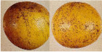
Melanosis ( Diaporthe citri )

La Melanosis es causada por el agente Diaporthe citri , este hongo ha sido registrado en la mayoría de los países productores de cítricos. Es una enfermedad de importancia económica en las regiones con regímenes abundantes de lluvia como Cuba durante las primeras etapas del desarrollo de la fruta.