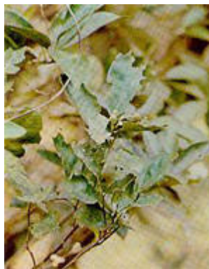
Una rama de naranjo dañada por la bibijagua ( Atta insularis )