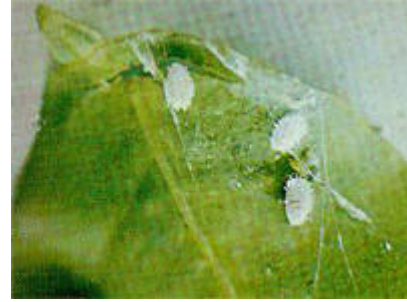
Hoja atacada por la Chinche harinosa ( Pseudococcus citri )